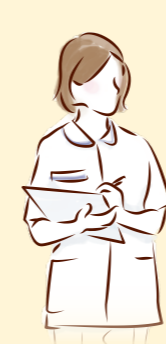
助産師さん・看護師さん